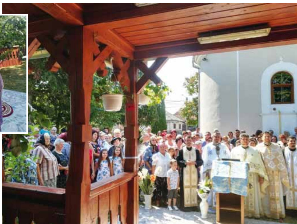
Cu vrerea Tatălui, ajutorul fiului și prin lucrarea Sfântului Duh s-a zidit între anii 1818-1830 biserica din Măgherăuș, cu hramul Adormirii Maicii Domnului.